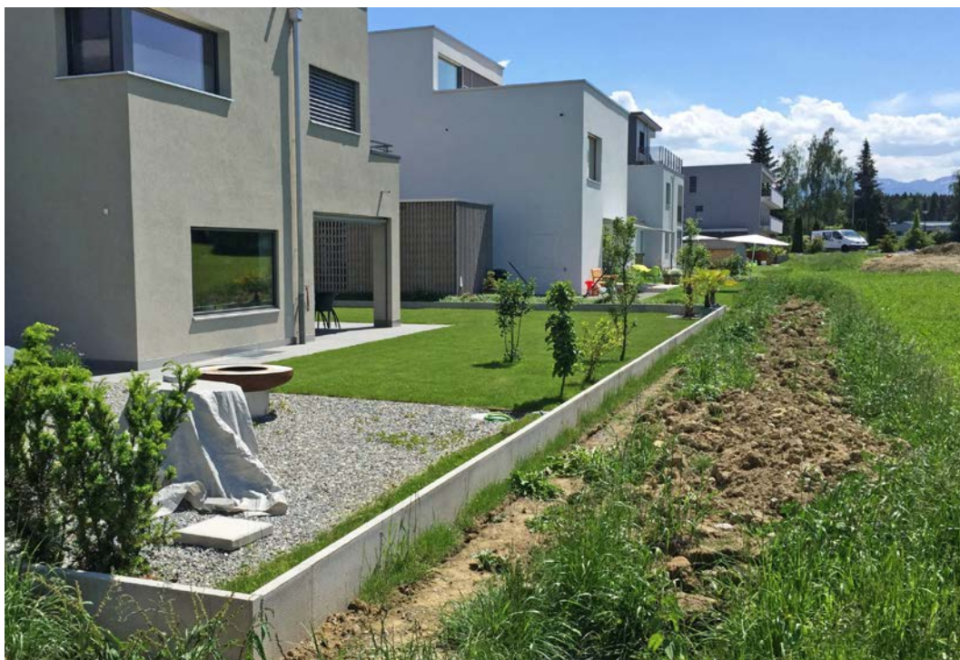
Baulicher Schutz gegen Oberflächenabfluss nach einem Gewitter, das den Keller überflutet und rund 200000 Franken Schaden verursacht hat. Heute liegt mit der Oberflächenabflusskarte ein Hilfsmittel für die Planung vor, das solche Schäden verhindern kann.

Auf dem Gelände des alten Flugfelds laufen nun seit dem Frühjahr 2019 die Bauarbeiten für die vom Architekten