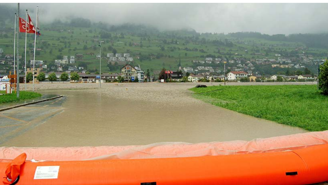
Beaver-Schläuche wirken als mobile Hochwassersperre und schützen hier die Gemeinde Ennetbürgen (NW) vor den Fluten der hochgehenden Engelberger Aa.