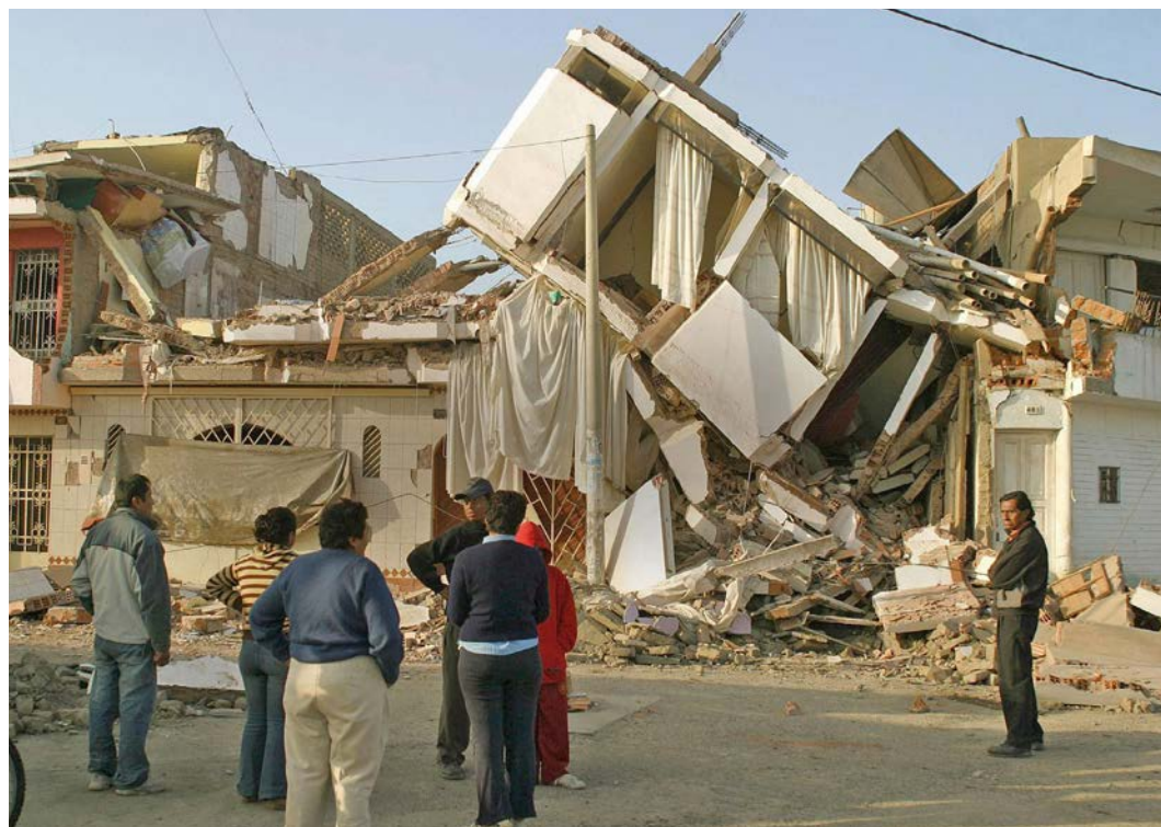
Naturkatastrophen – wie dieses Erdbeben in der peruanischen Kleinstadt Pisco – können vor allem ärmere Länder um Jahre zurückwerfen.

Das hierzulande aufgebaute Know-how soll dabei auch anderen Staaten zugutekommen – so etwa in Form von risikoorientierten Entwicklungsinvestitionen und Beratungen. Im Sinne eines konkreten Anschauungsunterrichts stellte die Schweiz am Innovationsstand in Genf ihr nationales Frühwarnsystem vor und bot ausländischen Besuchern nach der Konferenz Feldvisiten an, um ihnen verschiedene Präventionsmassnahmen zum Schutz vor Naturgefahren vor Ort zu demonstrieren.