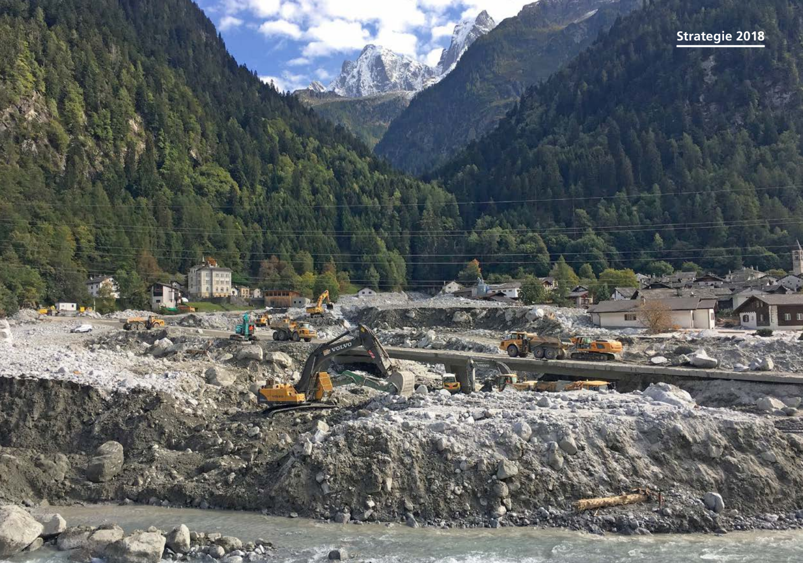
Aufräumarbeiten im bündnerischen Bondo nach dem Bergsturz am Piz Cengalo im August 2017.