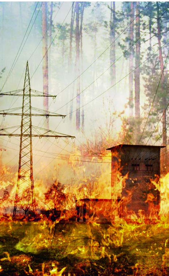
Bildmontage für die aktualisierte Strategie: Durch die vermehrte Sommer-trockenheit nimmt auch das Waldbrand-risiko zu. Vermehrte Unterbrüche der Infrastruktur können eine Folge davon sein.

auf zusätzliche Bauten, durch organisatorische und in letzter Priorität durch bauliche Schutzmassnahmen wirksam reduzieren. Wo das Bauen trotz einer gewissen Gefährdung erlaubt ist, sollen Bauten und Anlagen so erstellt werden, dass sie weniger verletzlich sind – und zwar auch gegenüber bisher eher vernachlässigten Gefahren wie dem hierzulande unterschätzten Erdbebenrisiko. Nicht zuletzt trägt auch der Aufbau von parallelen Systemen und Versorgungsketten dazu bei, dass lebenswichtige Güter und Dienstleistungen im Krisenfall nicht komplett ausfallen.