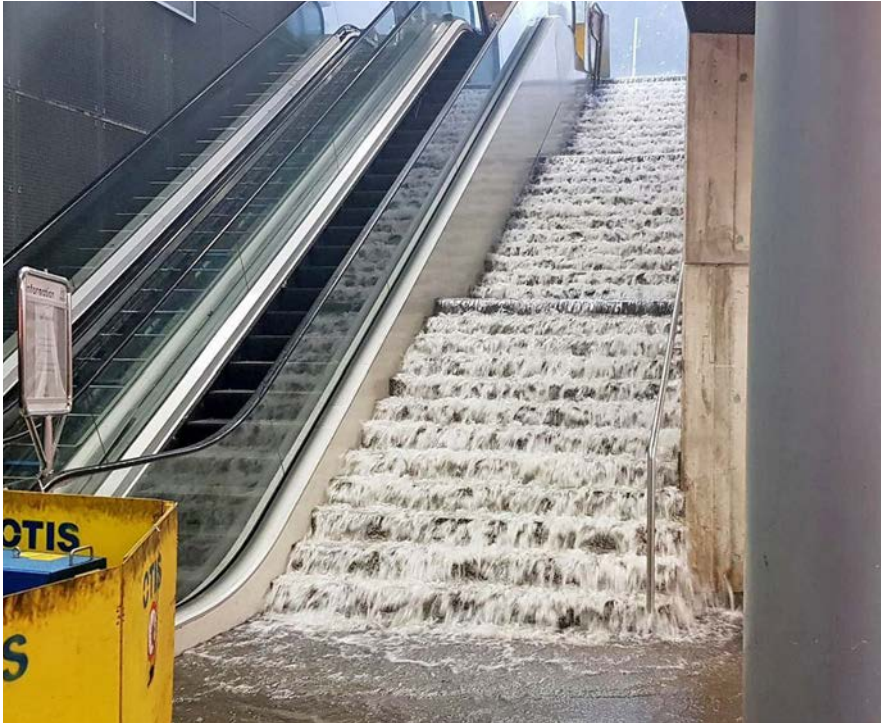
Oberflächenabfluss nach einem heftigen Sommergewitter in der Unterführung des Bahnhofs Nyon (VD).

solche Veränderungen laufend beobachten und beurteilen. Dies bedingt die Erarbeitung von einschlägigem Wissen zu künftigen Naturgefahren, den breiten Austausch des neu erworbenen Know-hows und das Antizipieren von künftigen Entwicklungen, damit die erforderlichen Schutzmassnahmen zeitgerecht eingeleitet werden können. Ein Beispiel dafür sind die vom Bund vorgelegten «Schweizer Klimaszenarien CH2018». Sie zeigen auf, dass sich unser Land bis zur Mitte dieses Jahrhunderts auf trockenere Sommer, heftigere Niederschläge, mehr Hitzetage und schneeärmere Winter einstellen muss.