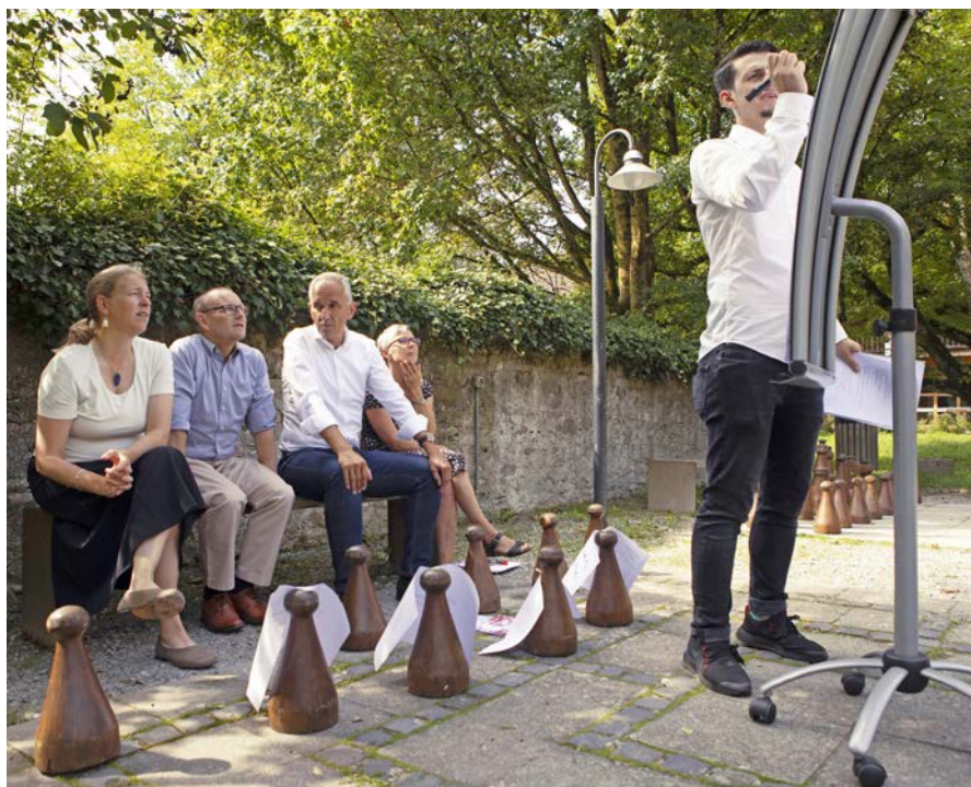
Workshop der PLANAT zur Weiterentwicklung eines umfassenden Risikomanagements.

Gemäss der Strategie der Schweiz ist die Sicherheit unseres Lebens- und Wirtschaftsraums eine Grundvoraussetzung für Lebensqualität und Wohlfahrt. Um die Widerstandsfähigkeit zu stärken, gilt es, mögliche Schäden durch Naturereignisse mit Hilfe der gesamten Massnahmenpalette auf ein tragbares Mass zu begrenzen. Dies gelingt, wenn den Risiken ausgewichen wird, indem Nutzungen vorzugsweise in gefahrenarmen Räumen erfolgen sowie durch eine risikobewusste Konstruktion und Nutzung von Gebäuden und Infrastrukturanlagen. In überbauten Gefahrenzonen lassen sich die Häufigkeit, Intensität und Folgen von Naturprozessen durch den Verzicht