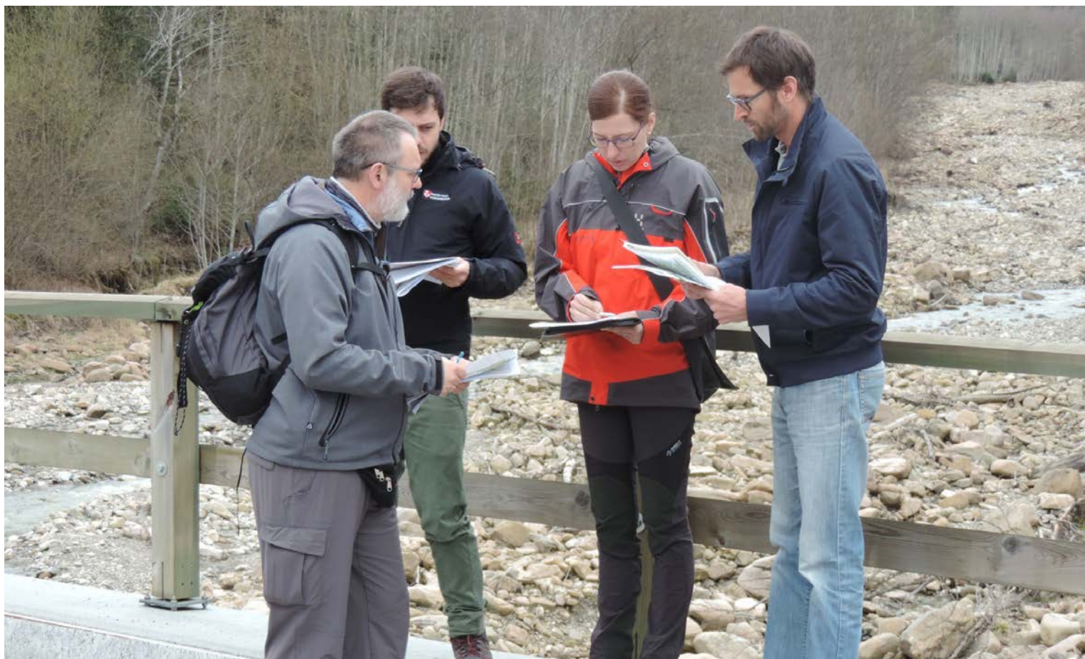
Praxisorientierte Ausbildung von lokalen Naturgefahrenberatern auf einer Brücke über das Schwarzwasser, einem Nebengewässer der Sense im Kanton Bern.

Wie die Auswertung der WSL zeigt, ereignen sich auch zahlreiche Todesfälle durch die übrigen Naturgefahren oft