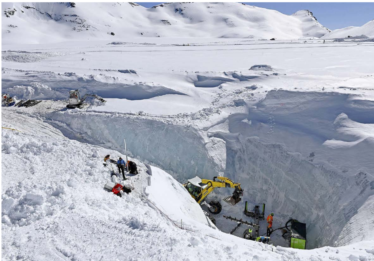
Auf dem Plaine-Morte-Gletscher wurde 2019 ein Eiskanal erstellt. Er hält den Gletschersee auf einem tiefen Niveau und schützt das Obersimmental auf Berner Seite damit vor hohen Abflüssen.

Gian Reto Bezzola betont jedoch, dass sich nicht alle klimabedingten Naturrisiken im Alpenraum mit baulichen