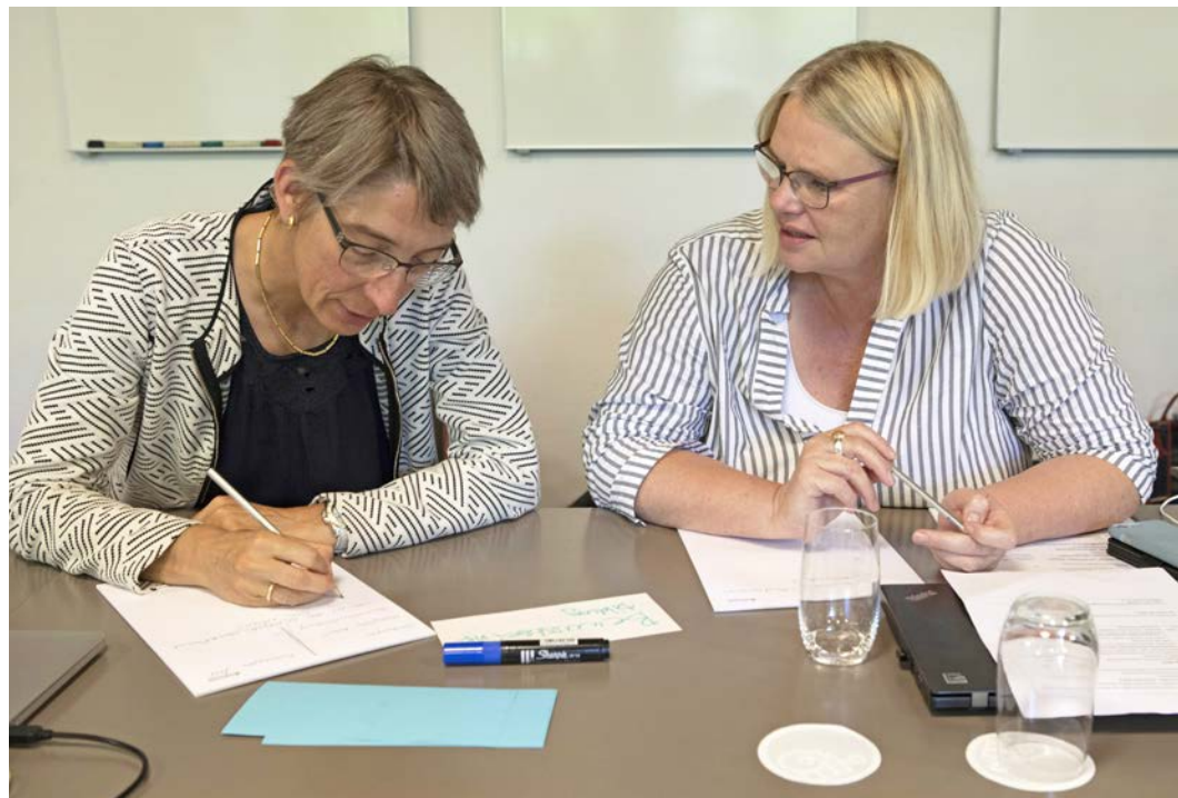
Kopfarbeit zur Förderung einer risikokompetenten Gesellschaft an einem PLANAT-Workshop.

Damit sich die Ziele der Strategie auch erreichen lassen, setzt die PLANAT mehrere Prioritäten für die Umsetzung. Demnach soll schweizweit ein vergleichbarer Umgang mit Risiken eingeführt und sichergestellt werden. Vor allem Behörden, Versicherungen, Planerinnen und Ingenieure sind angesprochen, auf allen Ebenen das IRM zu etablieren. Um neue inakzeptable Risiken zu vermeiden, braucht es zudem eine konsequent risikoorientierte Raumnutzung sowie ein naturgefahrengerechtes Bauen. Weitere Prioritäten betreffen das Klären der Zuständigkeiten unter den zahlreichen Akteuren, die Schärfung des Bewusstseins für die jeweilige Verantwortung der verschiedenen Beteiligten, eine verstärkte Forschung im Bereich Naturgefahren sowie den gegenseitigen Wissensaustausch und die Förderung der Solidarität.