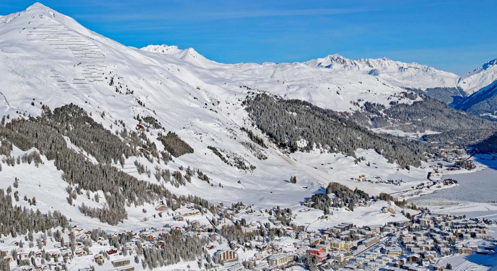
Die Lawinerverbauungen und der Schutzwald am Dorfberg oberhalb von Davos (GR) halten den Schnee am Berg zurück und schützen so das Siedlungsgebiet.