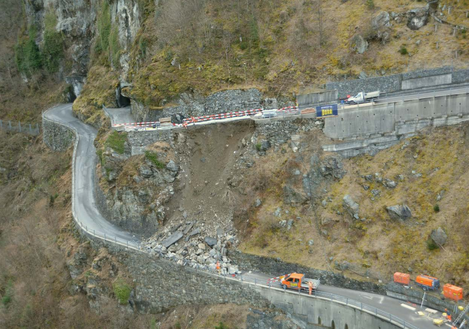
Im Frühjahr 2017 riss ein Erdbeben einen Teil der Urner Kantonsstrasse zwischen Amsteg und Bristen in die Tiefe. Dadurch war die Verbindung ins Maderanertal wochenlang unterbrochen.

rund um den Bahnhof zu starken Oberflächenabflüssen. Sie setzten dutzende von Gebäuden teils meterhoch unter Wasser – darunter auch das Kantonsspital.