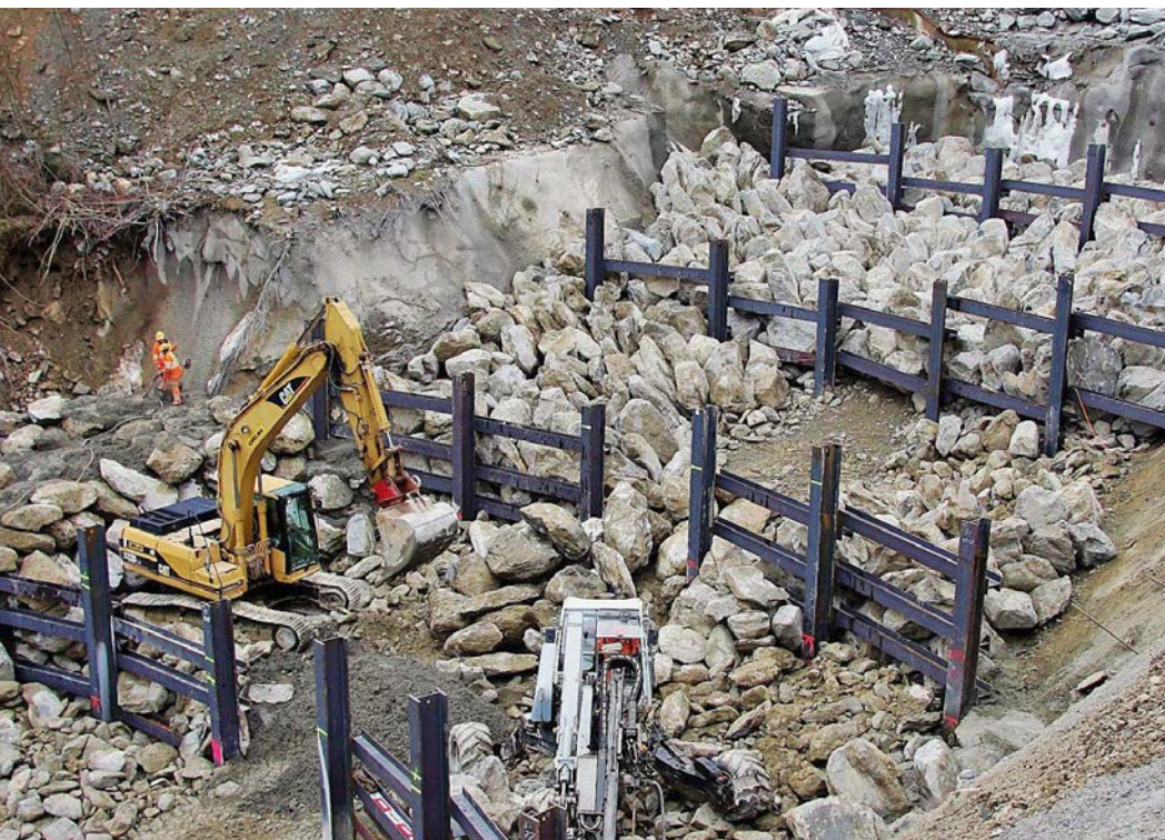
Bau einer Murgangsbremse im Spreitgraben bei Guttannen im bernischen Haslital. Die zaunartige Metallkonstruktion lässt das Wasser passieren und hält Murgangmaterial zurück.

In der laufenden Berichterstattungsperiode hat sich dies zum Beispiel am 11. Juni 2018 in der Waadtländer Hauptstadt Lausanne bestätigt. Infolge eines heftigen Gewitters fielen am späten Abend in nur zehn Minuten 41 Millimeter Regen, was hierzulande einem Messrekord gleichkommt. Weil die Böden und das Kanalisationssystem diese Wassermenge nicht aufnehmen konnten, kam es an den Hanglagen und im Zentrum