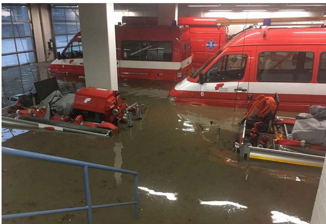
Totalschaden an Einsatzmaterial und Fahrzeugen in der Feuerwehrgarage Frauenfeld (TG) nach einem heftigen Sommergewitter.

Mario Botta entworfene Anlage, welche 7000 Personen Platz bieten soll. Der gut 51 Millionen Franken teure Neubau wird dereinst über teilweise mobile Objektschutzmassnahmen wie Schottwände und wasserdichte Türen verfügen, weil eine Hindernisbegrenzung für das Flugfeld Ambri die mögliche Bauhöhe limi-